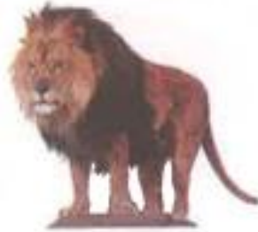
Lion (लायन्) सिंह