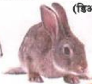
Rabbit (रॅबीट) ससा