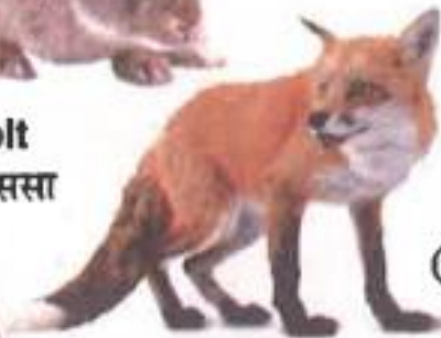
Fox (फॉक्स) कोल्हा