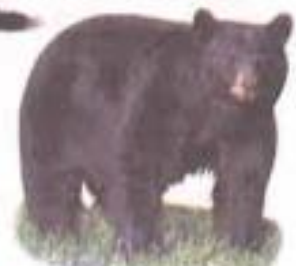
Bear (बेअर) अस्वल