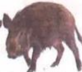
Boar (बोअर) रानडुक्कर