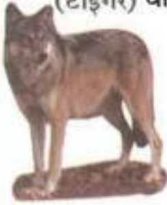
Wlof (वुल्फ) लांडगा