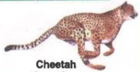
Cheetah (चित्ता) चित्ता