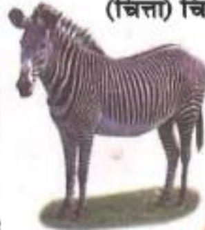
Zebra (झेब्रा) झेब्रा