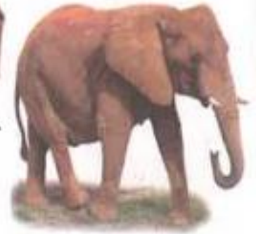
Elephant (एलिफंट) हत्ती