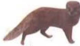
Moongoose (मांगूझ) मुंगूस