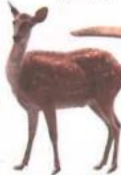
Deer (डिअर) हरिण