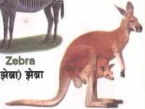
Kangaroo (कांगारू) कांगारू