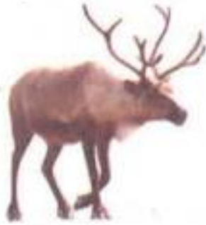
Reindeer (रेइनडिअर) रेनडिअर