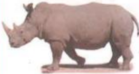
Rhinoceros (रायनॉसरस) गेंडा