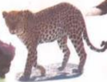
Leopard (लेपर्ड) चित्ता Panther (पॅन्थर) बिबट्या