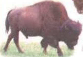
Bison (बायसन) गवा