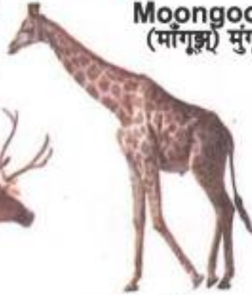
Giraffe (जिराफ) जिराफ